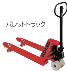
パレットトラック